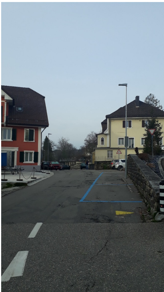
VUE - LIMITE PROJET EST