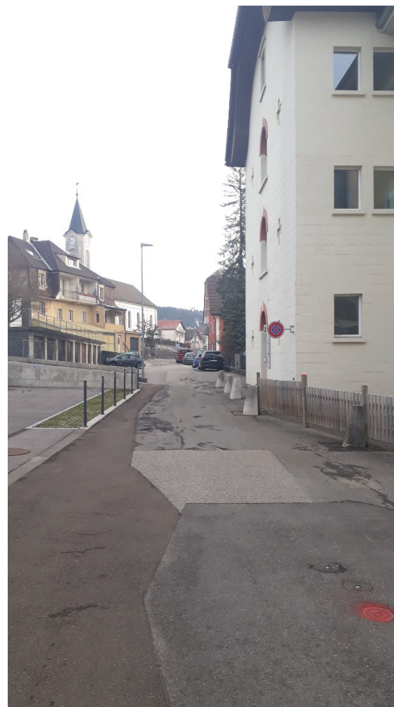
VUE - LIMITE PROJET OUEST