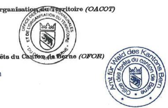
Plan de Quartier "Les Combattes" 2005

21. Mai 2019 Amt für Wald des Kantons Bern Bereich Waldrecht [Signature] Elias Kurt